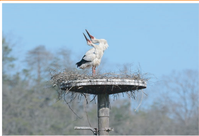
コウノトリってどんな鳥？