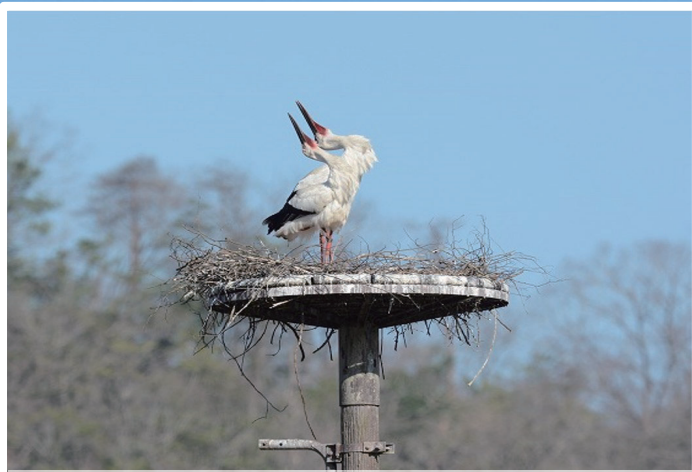
コウノトリってどんな鳥？