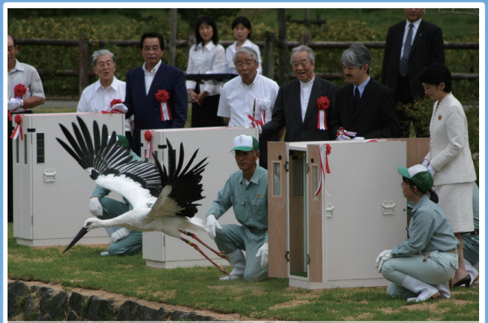
絶滅したのに野生復帰したのはなぜ？